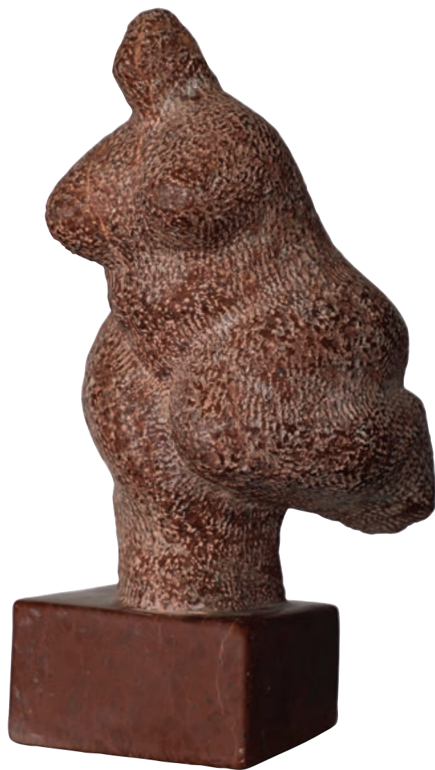
Hopa-cupa , 2016., boksit – lički kamen, 41 x 18 x 21 cm