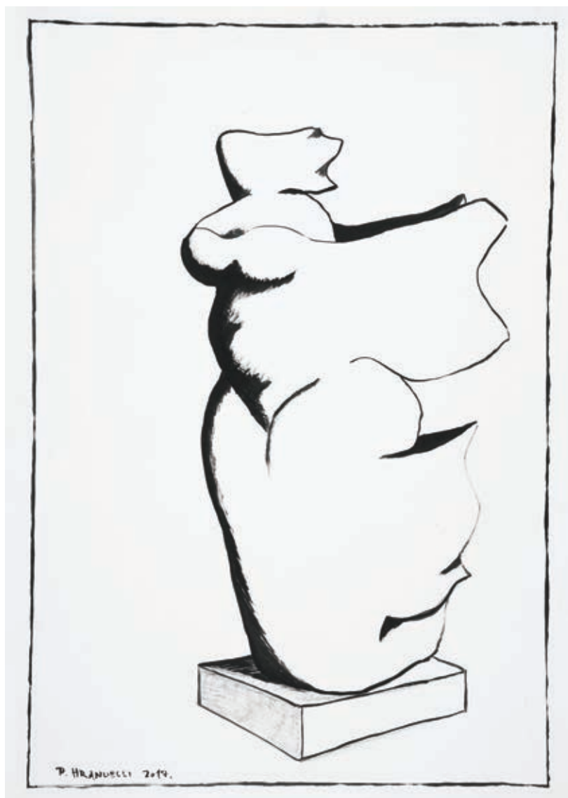
Crtež 9., 2017., tuš-papir, 100 x 70 cm