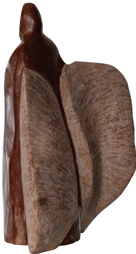
Anđeo teških krila, 2017., boksit - lički kamen, 33,5 x 24,5 x 15,5 cm