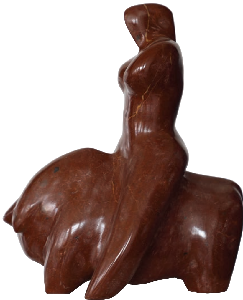
Europa , 2017., Boksit – lički kamen, 29,5 x 23,7 x 14,8 cm