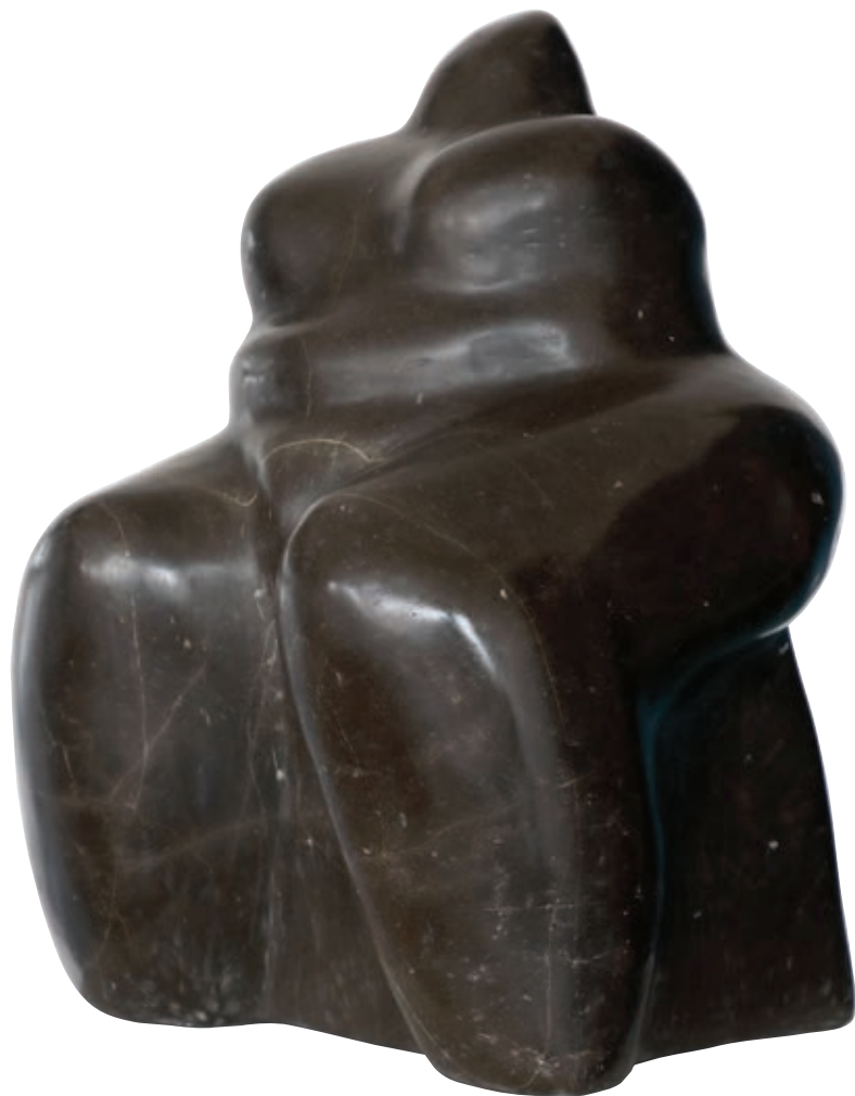
Umorna , 2013., lički kamen, 34 x 23 x 26 cm